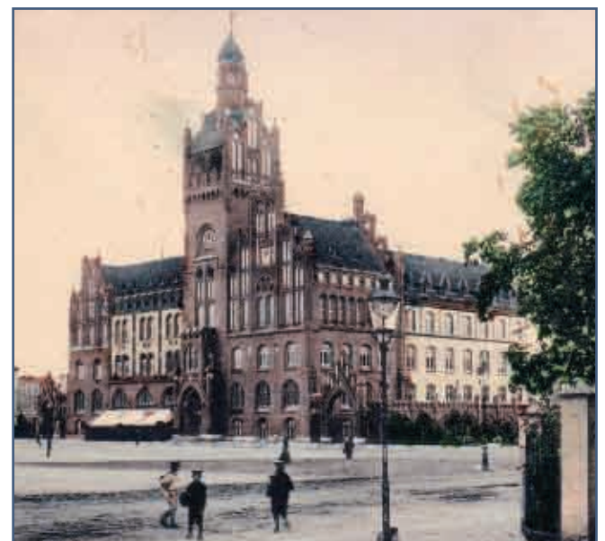
Lampa gazowa na Placu Zwycięstwa w 1908 roku

Jeśli chcesz wyrazić swoją opinię, zobacz jakim było miasto dawniej, zapraszamy do polubienia naszego profilu na Facebooku - Historyczny Słupsk - APR.