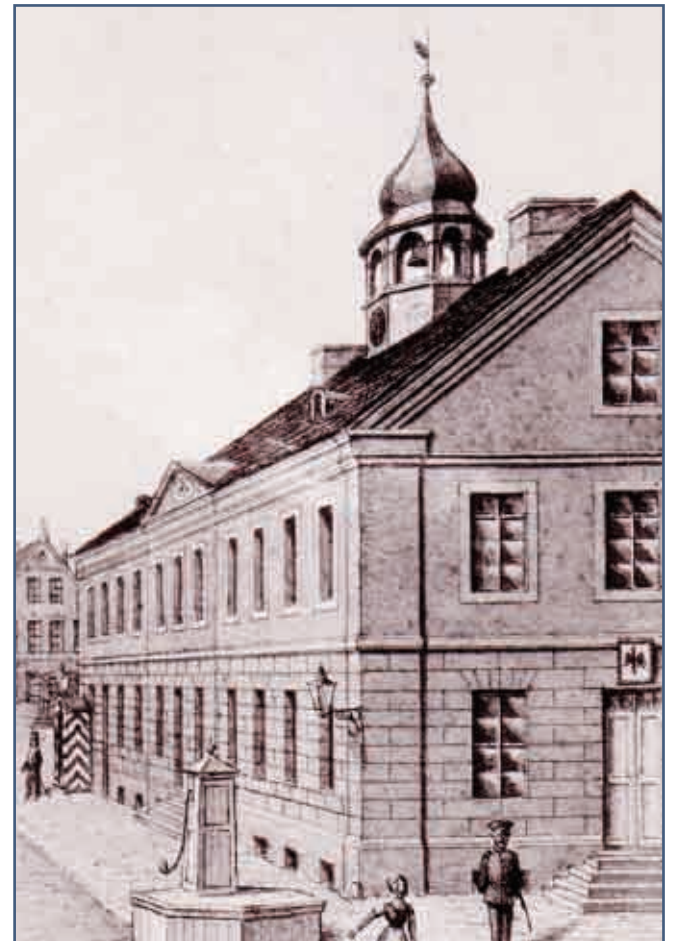
1857 rok - latarnie naftowe na ratuszu, stojącym na Starym Rynku

Zapewne wielu słupszczan pamięta łagodne i o ciekawym kolorze światło lamp gazowych oraz latarników ręcznie włączających o zmierzchu i gaszących o świcie latarnie. Charakterystycznym był także pracownik gazowni, który jeździł kucykiem, zaprzężonym do maleńkiej cysterny i za po-