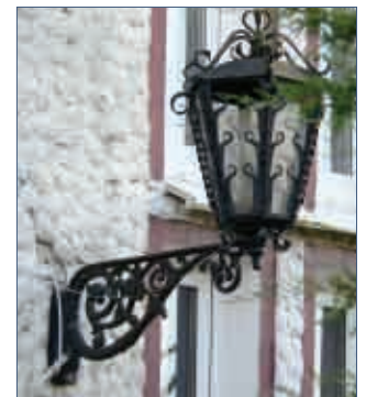
Jedyną prawdopodobnie pozostałością po słupskich latarniach jest oryginalna kandelabra, która zamontowana na jednym z domów przy ul. Łąkowej

Tomasz Urbaniak t.urbaniak@apr.slupsk.pl