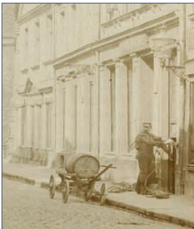
Koniec XIX wieku - latarnik na ul. Nowobramskiej w trakcie wypompowywania wody z odwadniaczy, którą przepompowywał do specjalnej kany