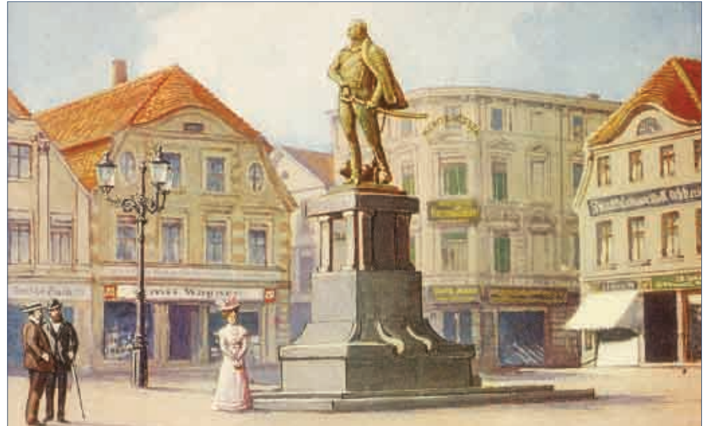
Pomnik von Blüchera na akwareli z około 1908 roku

Była to bitwa, w której przeciw siebie stanęło 160 tys. żołnierzy - Francuzów i połączonych wojsk pruskich i rosyjskich którymi dowodził „Marszałek Naprzód”. Walka toczyła się w strugach ulewnego deszczu na rozmiękłym gruncie. Zwyciężyli Prusacy, którzy lepiej wykorzystali teren i posiadali więcej żołnierzy wyszkolonych do walki wręcz. 18 października 1813 roku dowodząc prawym skrzydłem koalicyjnych wojsk prusko-rosyjskich, tzw. armią śląską, Blücher przyczynił się do decydującego zwycięstwa w bitwie pod Lipskiem. Za to w 1814 roku mianowano go feldmarszałkiem, a ogólnie za zasługi w bitwie pod Lipskiem i Kaczawą Blücher otrzy-