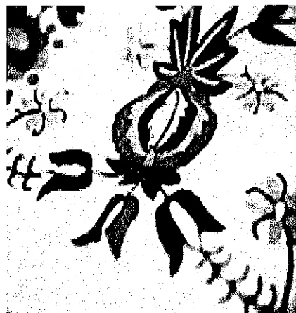
WZORY HAFTU KASZUBSKIEGO SZKOŁA SŁUPSKA

Również w tym gatunku dominuje ornamentyka florystyczna ( stokrotki , niezapominajki i piwonie ). Specyfiką gatunku jest prawie zupełny brak koloru czerwonego i zupełna dominacja odcieni zieleni i błękitu [2] .