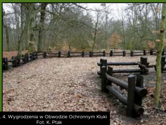
Ryc. 4. Wygradzenia w Obwodzie Ochronnym Kluki