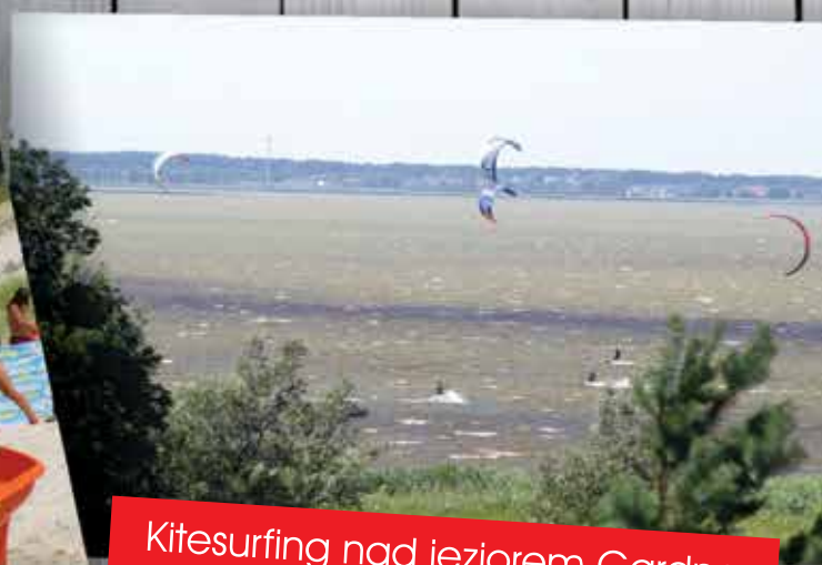
Kitesurfing nad jeziorem Gardno