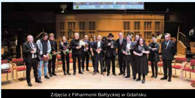
Zdjęcia z Filharmonii Bałtyckiej w Gdańsku