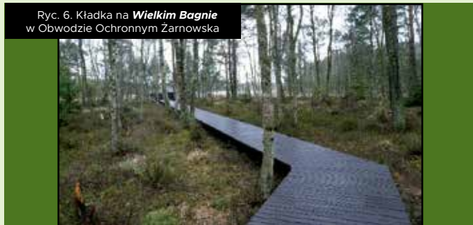
Ryc. 6. Kładka na Wielkim Bagnie w Obwodzie Ochronnym Żarnowska

Kładka w Obwodzie Ochronnym Żarnowska (Ryc. 6, 7) zlokalizowana jest przy żółtym szlaku, na pograniczu dwóch gmin: Wicko oraz Główczyce. Kładka zakończona jest pomostem wychodzącym na torfowisko regenerujące się, tzw. Wielkie Bagno . Łączna długość kładki to ok. 131 m, jej celem jest ochrona regenerującego się torfowiska oraz gatunków roślin objętych ochroną ścisłą. Podobnie jak w przypadku kładki na wydmy szarej w obrębie drewnianego pomostu zamontowana została tablica edukacyjna opisująca charakterystyczne gatunki tego torfowiska, m.in. żurawinę błotną, mchy torfowców, modrzewnicę zwyczajną, wrzosec bagienny, wełniankę pochwowatą, a także rosiczki. Torfowisko jest ponadto ostoją dla awifauny, można tu zaobserwować m.in. bieliki i żurawie.