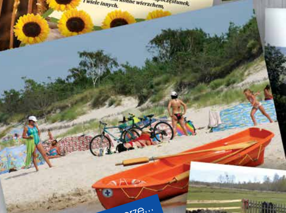
Rowery, plaża, morze...