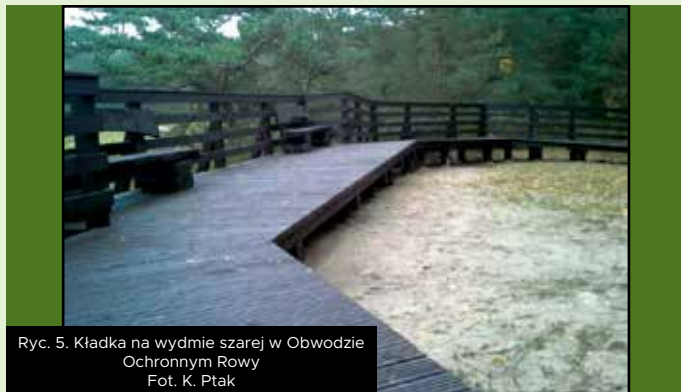
Ryc. 5. Kładka na wydmy szarej w Obwodzie Ochronnym Rowy

W Obwodzie Ochronnym Rowy odtworzono kładkę na wydmy szarej (Ryc.5), która znajduje się w obrębie ścieżki przyrodniczej Rowy. Kładka o długości 46,5 m, ogranicza antropopresję w obrębie priorytetowego siedliska Obszaru Natura 2000 - nadmorskie wydmy szare. Nazwę wydmy szare biorą od barwy substancji próchnicznych, które wraz z porostami i mchami pokrywają piaszczyste podłoże. Wśród roślin charakterystycznych (opisanych na tablicy edukacyjnej, zlokalizowanej przy kładce), które można zaobserwować w obrębie tej wydmy są: fiołek nadmorski, bylica polna, szczotliha siwa, turzycza piaszkowa, jasioniec piaszkowy i kokanki piaszkowe.