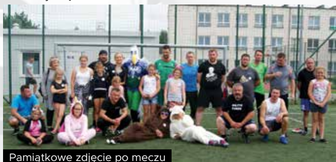
Pamiętkowe zdjęcie po meczu

swój premierowy występ miał Boguś – maskotka Gminy Smołdzino. To on poprowadził uczestników rajdu rowerowego trasą Smołdzino-Człuchy, a następnie czarnym szlakiem do "Czarciego Kręgu". Warto zaznaczyć, że ogłoszony został konkurs na najciekawsze przebranie. Wśród rowerzystów pojawiły się motylki, misie, czarodziejki, Anna de Croy, kotki .... W tym samym czasie na Orliku odbywał się mecz samorządowcy kontra mundurowi. Mecz zakończył się remisem 2:2.