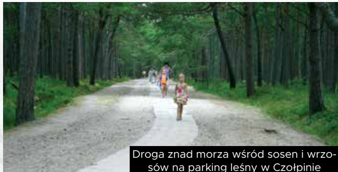
Droga znad morza wśród sosen i wrzósów na parking leśny w Czołpinie

Z Ustki do Czołpina można dojechać przez Objazdę i Smołdzino, a z Łeby przez Wicko i Smołdzino. Z parkingu ruszamy w stronę ruchomych wydm i do Latarni Czołpino. Potem dłuższa wycieczka plażą na zachód i trafiamy do Czerwonej Szopy.