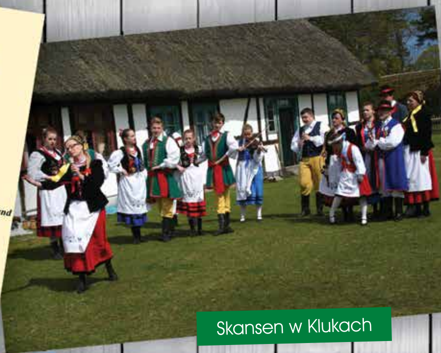
Skansen w Klukach