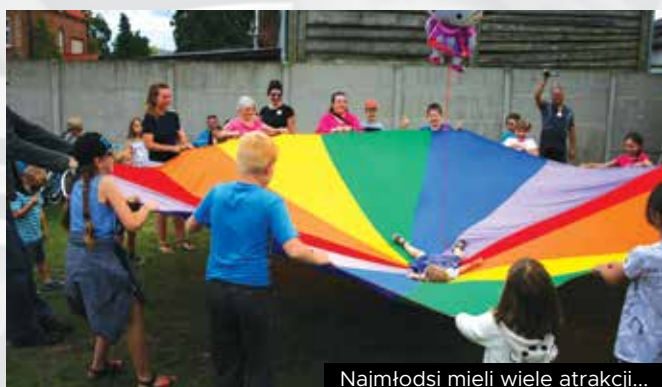
Najmłodsi mieli wiele atrakcji...

Na placu za GOK zabawy dla najmłodszych prowadzili animatorzy z Teatru Obieżyświat. Wiele radości sprawiło malowanie twarzy, pokazy baniek mydlanych, chodzenie na szczudłach, zabawy z chustą KLANZA. Pracownicy Słowińskiego Parku Narodowego zapewnił duży dawkę zabaw edukacyjnych. Na sali w GOK ogromnym zainteresowaniem wśród dzieci i dorosłych cieszyły się warsztaty bębniarskie.