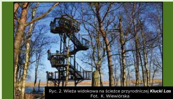
Ryc. 2. Wieża widokowa na ścieżce przyrodniczej Klucky Las