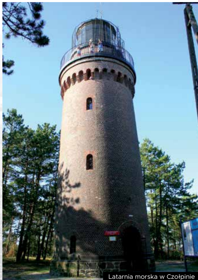
Latarnia morska w Czołpinie

Po przygodzie na latarni i przejściu przez pasmo lasu można już podziwiać upragnioną szeroką plażę z pięknym morzem. Tutaj można posiedzieć, posłuchać szumu fal, wykapać się pod okiem ratowników, lub udać się do Czerwonej Szopy . Na wydmi ukazuje się stosowny drogowskaz, skręcamy więc w lewo na ląd i ponownie wkraczymy w strefę leśną. To całkiem normalne, że stanowisko WOPR usytuowano w pobliżu Czerwonej Szopy na plaży w Czołpinie. Szopę wzniesiono w latach dwudziestych XX wieku. Obiekt użytkowany był przez wiele lat jako stacja ratownictwa morskiego. To właśnie w Czerwonej Szopie jak nazywali ją oko-