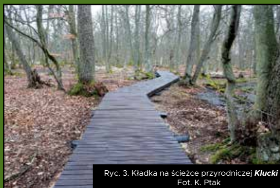
Ryc. 3. Kładka na ścieżce przyrodniczej Klucky Las