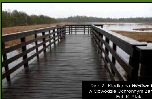
Ryc. 7. Kładka na Wielkim Bagnie w Obwodzie Ochronnym Żarnowska

Dzięki zakupie czujników ruchu (7 szt.) Słowiński Park Narodowy może dokonywać monitoringu oraz analizy ruchu turystycznego na terenie obszaru chronionego.