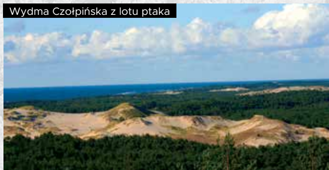
Wydma Czołpińska z lotu ptaka

Wszędzie piasek i roślinność wydmowa. Mamy do pokonania kilka wyższych i niższych wydm, kiedy wydaje nam się, że za kolejną zobaczymy morze, a ukazuje się las. A na wzgórzu... Tajemniczym okiem wita nas latarnia morska Czołpino - położona jest pomiędzy Łebą, a Rowami na terenie Słowińskiego Parku Narodowego. Latarnię posadowiono na wzgórzu, pośród iglastego lasu porastającego wydmę Słowińskiego Parku Narodowego, około 1000 metrów od brzegu morskiego, na najwyższej wydmi w grupie wydm - nazywanej "Baranki". W 1872 roku podjęto decyzję o budowie latarni, a już na początku 1875 prace budowlane zakończono. Materiał budowlany, w tym potężne głązy granitowe przetransportowano na statkach, morzem. W latarni zainstalowano układ optyczny składający się z żarówki o mocy 1000W i cylindrycznej soczewki Fresnela o średnicy 1,8 m i wysokości 2,75 m składającej się z 43 półpłaszczyzn. Światło jest widoczne dookoła, ale jest też wzmocnione przez soczewkę tylko od strony morza. Świeci 3s i 1s z przerwami 2s. To najważniejsza latarnia morska na polskim wybrzeżu. Wysokość latarni wynosi 25,2 m. U podstawy wieża ma średnicę 7 m. Latarnia przetrwała wojnę w stanie nie zmienionym. W latach 1993-94 przeprowadzano jej renowację i udostępniono do zwiedzania. Kto raz na nią wejdzie, zawsze będzie tam wracał. Fantastyczne miejsce do fotografowania.